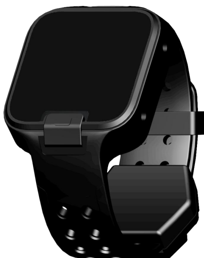
图 1-1 VD1502-PBR 产品图片

VDU1502-PBR UWB 防自解定位手表，主控芯片采用 NRF52832 实现低功耗的待机，定位包的收发控制，定位方案采用 DW1000 实现基于 UWB 的 TDOA 室内高精度算法。可以实现佩戴人员的高精度室内定位。内置加速度传感器，智能切换人员运动和静止时的定位频率，实现最低功耗的待机。同时手表带有 SOS 按键求救功能，可以实现敬老院、工地、工厂、矿道、医院、监狱等安全监护场合的人员定位。表内配置心率传感器，周期性回传监护人员的心率数据；表带自带防自解检测，表带被剪断或者拆卸将发送信息到后台。不带屏手表内置一颗高亮 LED 灯，对手表不同功能的工作状态进行提醒。