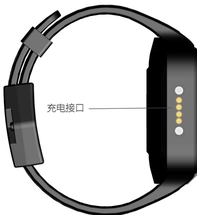
图 3-2 VDU1502-PBR 侧面