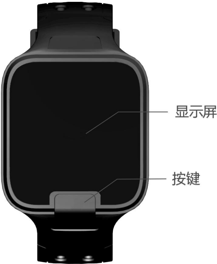
图 3-1 VDU1502-PBR 正面