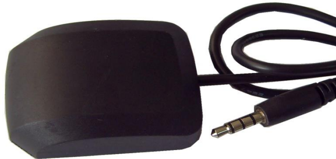
图 1: SKM51F 正视图

SKYLAB SKM51F 系列具有嵌入式 GNSS 天线，可以在最严格的应用程序中实现高性能导航，甚至在严酷的 GNSS 可见环境中也能实现可靠的定位。它是基于单片架构的高性能 GNSS 单芯片，-165dBm 跟踪灵敏度将定位覆盖扩展到城市峡谷和茂密的树叶环境中。标准连接插头的设计是与其他电子设备进行通信的最简单、最方便的解决方案。